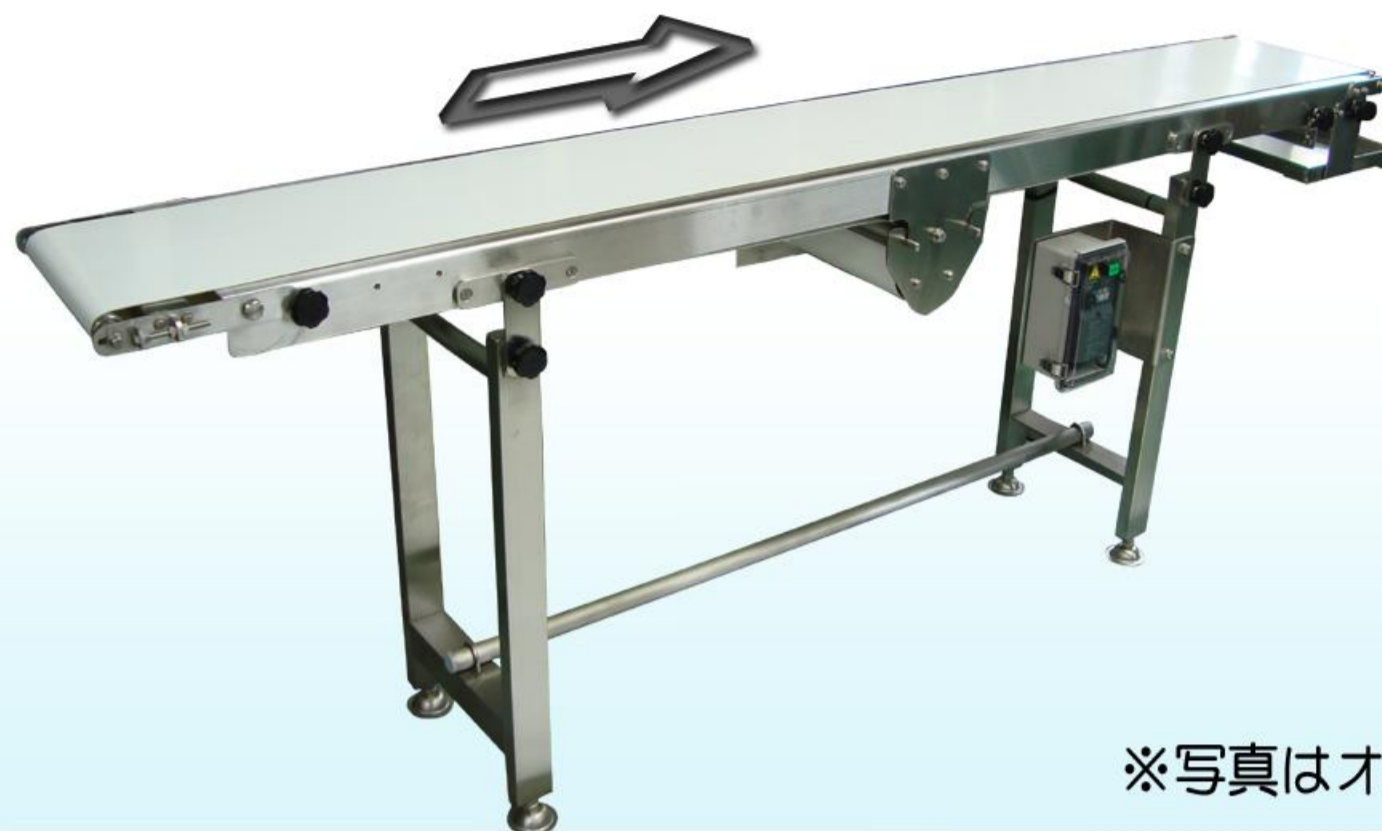
※写真はオプション付です。