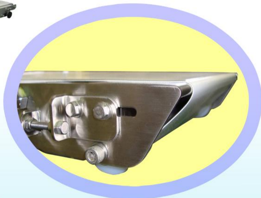
※写真はオプション付です。