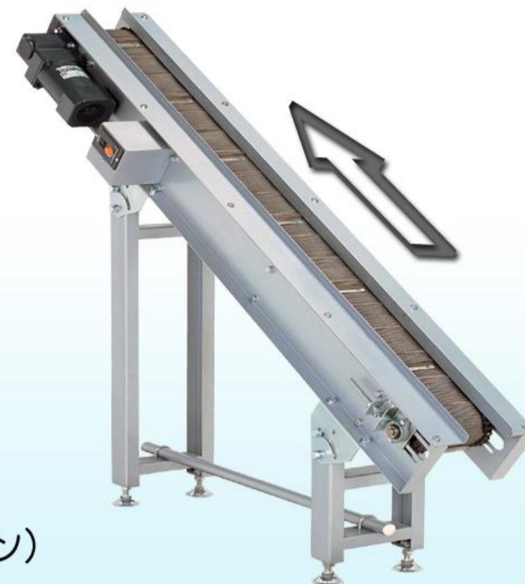
(スタンドはオプション)